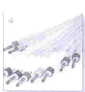
wtyk bananowy 4mm, z otworem